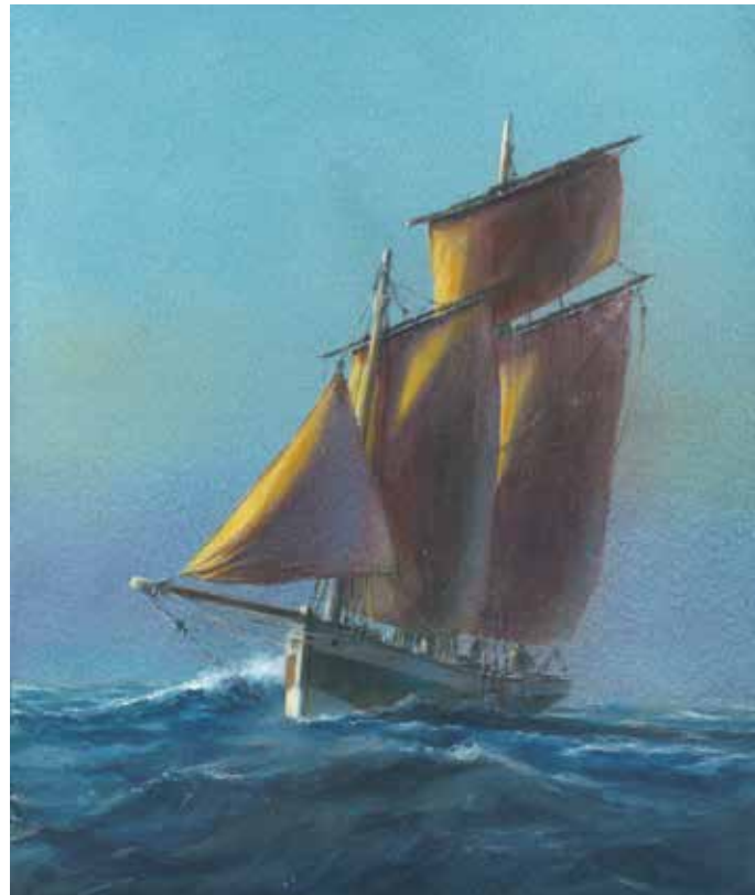
Fresque réalisée par Gildas Chasseboeuf, exposée sur le pignon du Conservatoire du littoral, 8, quai Gabriel Péri au port du Légué.

Peinture sur voile par Gildas Chasseboeuf ; les mini-navigateurs de Plédran ; Vélo sans âges ; escape game (le secret du Légué - départ place de la résistance face à la poste pour un parcours tout autour du port - inscription sur www.billetweb.fr/le-secret-du-legue ) ; espace enfants devant le Grand Léjon (bricolage, pêche à la ligne, buvette enfants).