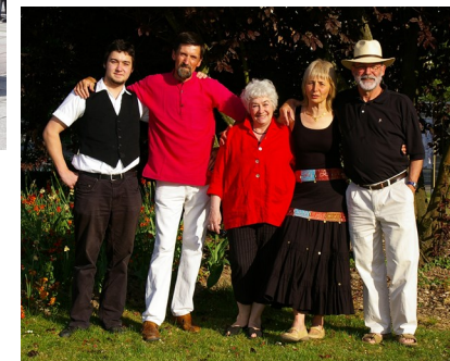
Gabal & Cie